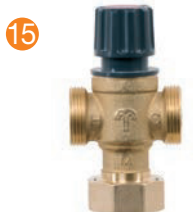
Brauchwassermischer Domestic water premixing