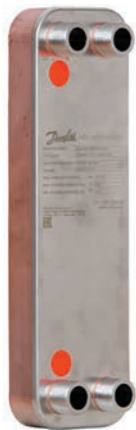
Edelstahl- Plattenwärmetauscher heat exchanger in stainless steel