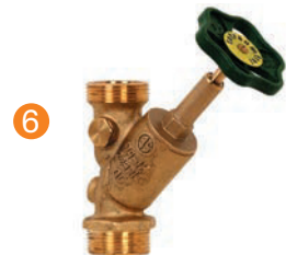
KW-Freistromventil KW free-flow valve