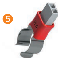
Rohrclipsensensor Pipe clip probe