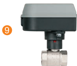
Kaskadenventil Cascade valve